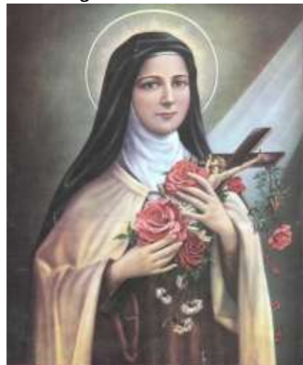
св. Тереза від Дитятка Ісус

Кожна святість є дуже індивідуальною, але святість «квітки Кармелю» є в своєму роді виключною і говорить про це її місце в Церкві. Адже запитуєш себе: як молода, п'єндітна дівчина, відійшовши до Бога на ранній зорі свого життя стала святою, покровителькою Франції, і не просто святою, а (не навчаючись у жодному вищому