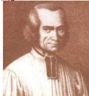
св. Йоан Марія Віаней

Тільки Святий Дух допомагає від-різнити прав-ду від фальші, добро від зла. Він, як збіль-шувальне скло,