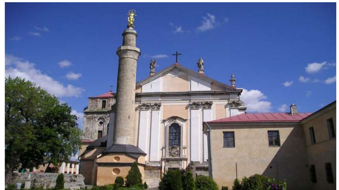
Катедрa в Кам'янці-Подільському