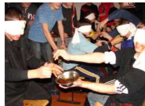
Весело та цікаво проводити час у семінарії

З 19 по 31 березня семінаристи роз'їхалися на канікули, на котрих допомагали пробоцям в приготуванні і святкуванні Христового Воскресіння. Крім того 6 семінарств приготували літургійну службу під час Трійци в кафедрі в Кам'янці-Подільському.